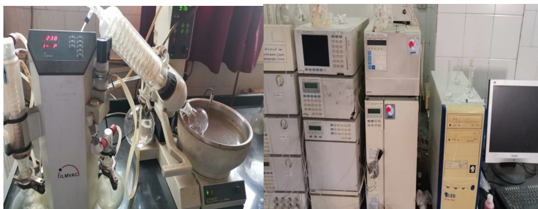
الصورة (٢): المبخر الدوار