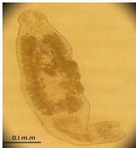
(الشكل 2 النوع الطفيلي Cichlodogyrus sp ) المعزول من أسماك المشط الأزرق

يتبع هذا النوع Monogenea فصيلة Dactylogyridae جسم الطفيلي ممدود شفاف صغير الحجم يقيس (0.2-0.6) m.m غير مقسم إلى مناطق واضحة ظاهرياً، الجزء الخلفي المتخصص بالارتباط بالأنسجة المضيفة (الغلاصم)، يحمل أقراص تثبيت (anchors) الذي يمتلك خطافين ظهري وبطني يختلفان في الشكل بين الأنواع، وقضيب عرضي ظهري وآخر بطني يسندان الخطاطيف، وسبعة أزواج من الخطاطيف الصغيرة marginal hooks تستخدم في التثبيت وتحتف أطوالها تبعاً للأنواع [24] الشكل (2)، تسبب هذه الطفيليات ضعف الحيوية والنشاط وقللة الشهية، كما تسبب شحوباً في الغلاصم وزيادة في إفراز المادة المخاطية [25]، ويعد هذا الطفيل عالي التخصص على أسماك Oreochromis [26].