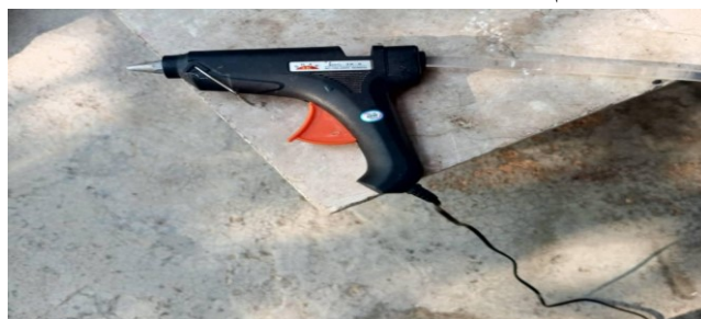
الشكل(8): فرد السيلكون.

فرد السيلكون استخدم من أجل إلصاق الشبك الناعم حول الثقوب فقط للأنايبب الرئيسية و الفرعية. يوضح الشكل (8) فرد السيلكون المستخدم