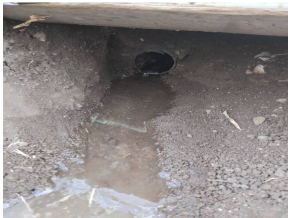
الشكل (12): أنبوب التصريف.

تم تركيب الشبكتين بتصميمين مختلفين حيث كان التصميم بشكل متوازي أي من دون وجود ميلان للأنايبب، أما التصميم الثاني كان بشكل مائل أي بوجود زاوية ميلان للأنايبب بمقدار ( 45^\circ ).