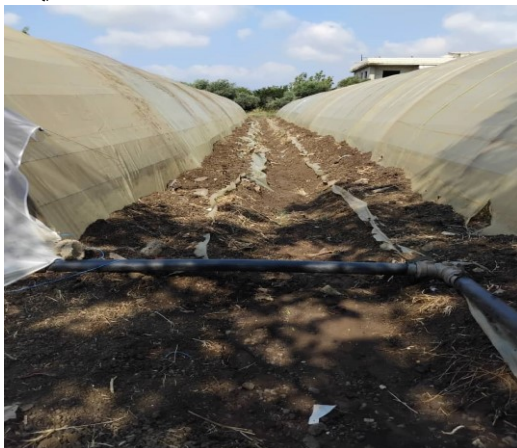
الشكل (11): الخندق حول البيت المحمي.

٢- تم حفر خندق حول البيت البلاستيكي لضمان عزل المنطقة المدروسة ومنع تسرب المياه إلى النطاق المدروس. يوضح الشكل (11) الخندق حول البيت المحمي.