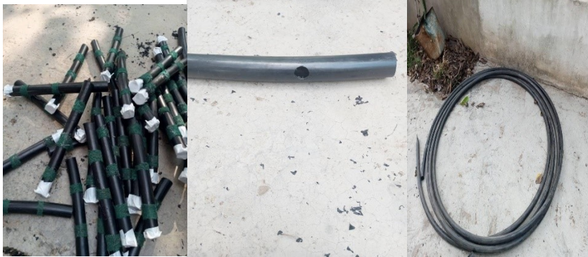
الشكل (5): الأنابيب الفرعية قبل القص والتنقيب. الشكل (6): الأنابيب الفرعية بعد القص والتنقيب. الشكل (7): الأنابيب الفرعية وتغطية الثقوب بشبك ناعم.