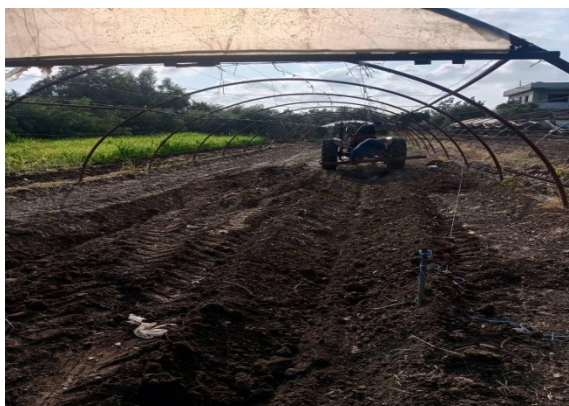
الشكل (10): تسوية الأرض.

على عمق (30cm). تمت عملية تسوية الأرض من أجل وضع الشبكات باستخدام المحراث كما يوضح الشكل (10)