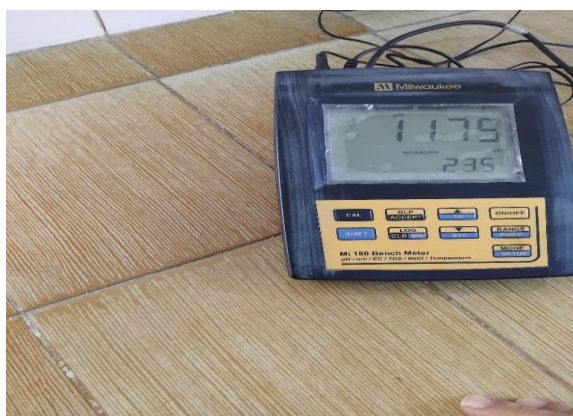
الشكل (2): الجهاز المستخدم في تحليل مياه البئر الارتوازي.

✓ تم تحليل مياه البئر الارتوازي الذي تروى منه التربة في مركز البحوث الزراعية في بيت كمونة حيث بلغت قيمة الناقلية الكهربائية للماء (1.76)، و بلغت قيمة PH المياه (7.54). يوضح الشكل (2) الجهاز المستخدم في عملية تحليل المياه