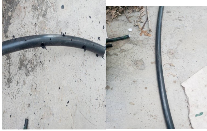
الشكل (3): الأنبوب الرئيس قبل التنقيب. الشكل (4): الأنبوب الرئيس بعد التنقيب.