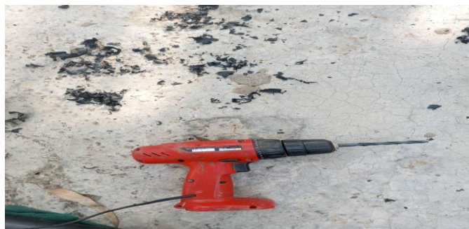
الشكل(8): المثقب المستخدم في عملية التثقيب.

فرد السيلكون استخدم من أجل إلصاق الشبك الناعم حول الثقوب فقط للأنايبب الرئيسية و الفرعية. يوضح الشكل (8) فرد السيلكون المستخدم