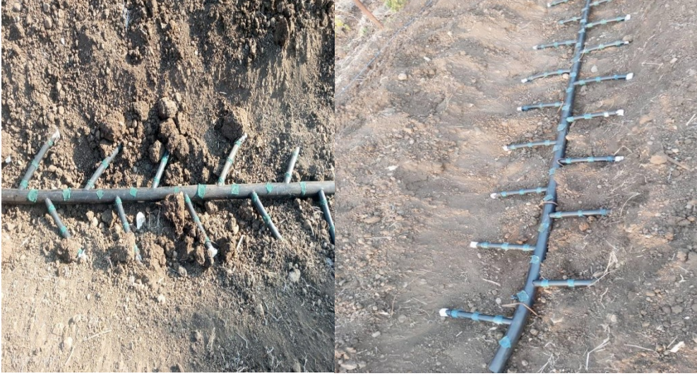
الشكل (13): التصميم المتوازي للشبكة.