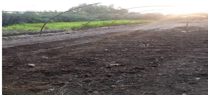
الشكل (1): البيت المحمي المستخدم في التجربة.

تم إجراء التجربة في قرية السوداء، منطقة كرتو، محافظة طرطوس، خلال شهر تموز (2024) حيث تم اختيار مساحتين متساويتين من البيت المحمي (9*6.5 m 2 ). يوضح الشكل (1) البيت المحمي المستخدم في التجربة.