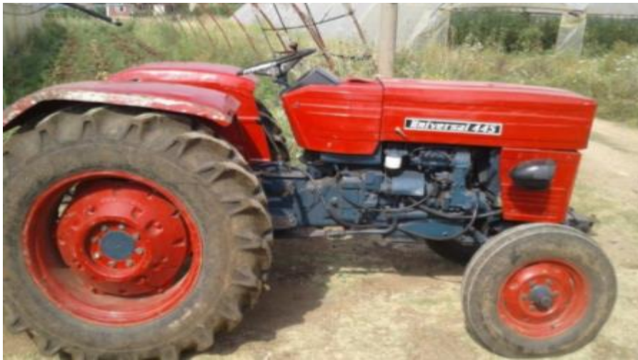
الشكل (3):الجرار المستخدم في التجربة.

1-جراردولاب روماني المنشأ، ثنائي الدفع، بمحرك ديزل رباعي الأشواط، ذو قدرة حصانيه(25) حصان ميكانيكي، طوله(280cm)،ارتفاعه(130cm)،الوزن الكلي للجرار(2860kg)،سعة خزان الوقود (20)، حالة الجرار جيدة جدا.الشكل (3).