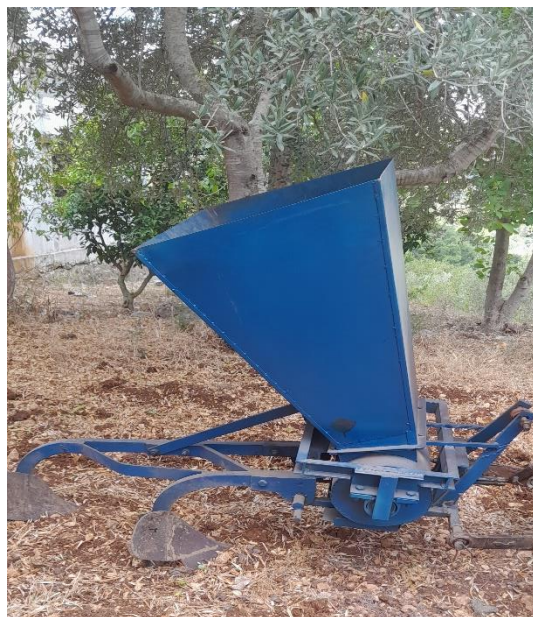
الشكل (4): المركب الآلي المستخدم

يتكون المركب من الأجزاء الرئيسية الآتية: