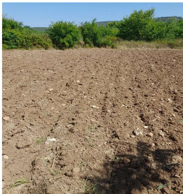
الشكل(1): موقع تنفيذ البحث

نُفذ البحث في إحدى القرى الزراعية التابعة لمنطقة الدريكيش، ضمن محافظة طرطوس في العام (2024) حيث كانت الأرض مستوية. وتتميز القرية بمناخها الصيفي الجاف والشتاء الرطب المعتدل. يبين (الشكل 1) موقع تنفيذ البحث.