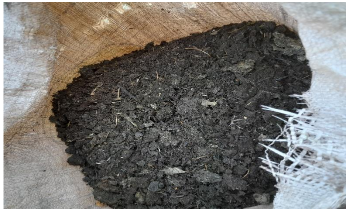
الشكل(5):السماد المستخدم .

تم اختيار السماد العضوي ذو الأصل البقري الذي يتميز بلونه البني الداكن المائل الى الأسود، منقته ذو قوام متجانس، وخفيف الوزن فيقلل الضغط على التربة وقد أجريت التحاليل الفيزيائية والكيميائية اللازمة وفق الطرق المتبعة عالمياً في محطة بحوث بيت كمونة. بينت التحاليل غناه بالمادة العضوية (37.58%) ونسبة رطوبة (25%). الشكل(5)